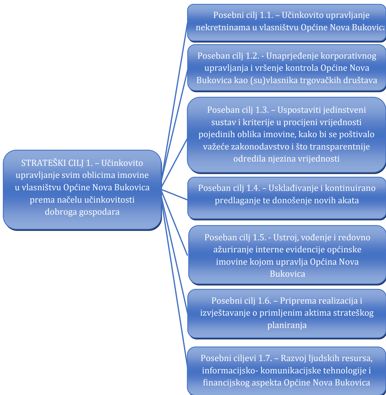
Slika 2. Kaskadiranje strateškog cilja upravljanja općinskom imovinom